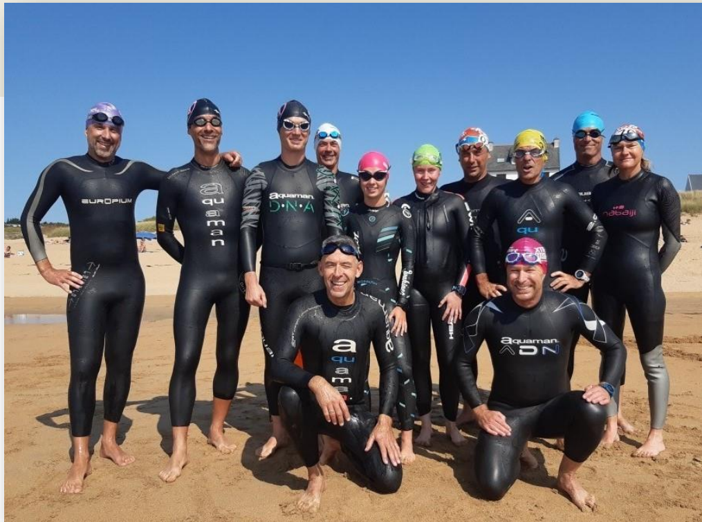
Les KT avant le départ du tri OFF du Pouldu