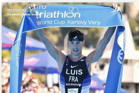
Vincent Luis remporte la coupe du Monde, une semaine après son 2 ème titre mondial!

Et pendant ce temps-là, à St Lunaire ou en Tchécoslovaquie, les bretons et les français brillaient dans notre sport favori : le Triathlon!