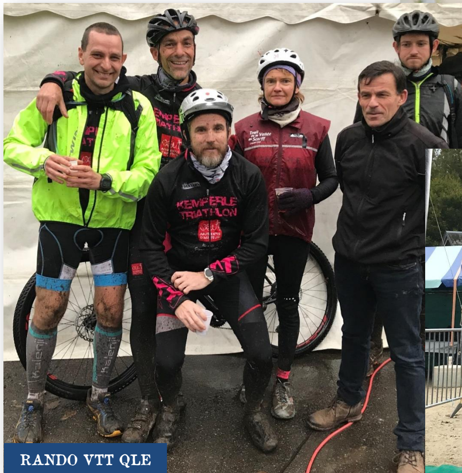
RANDO VTT QLE