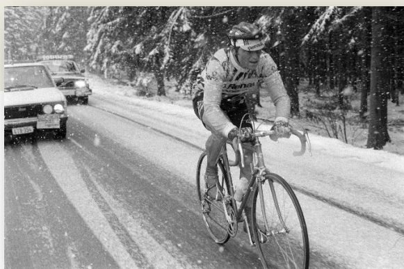
Une pensée pour nos skieurs