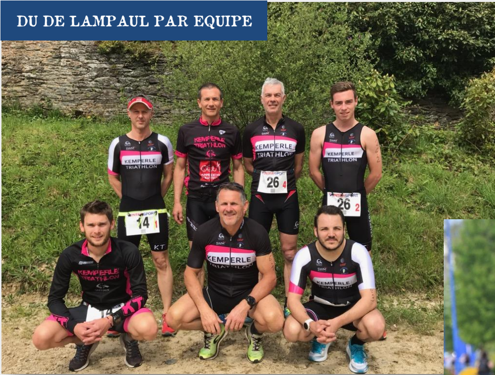
DU DE LAMPAUL PAR EQUIPE