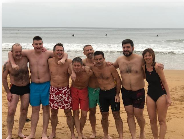
Le bain de la mort du 1 er : même pas morts!