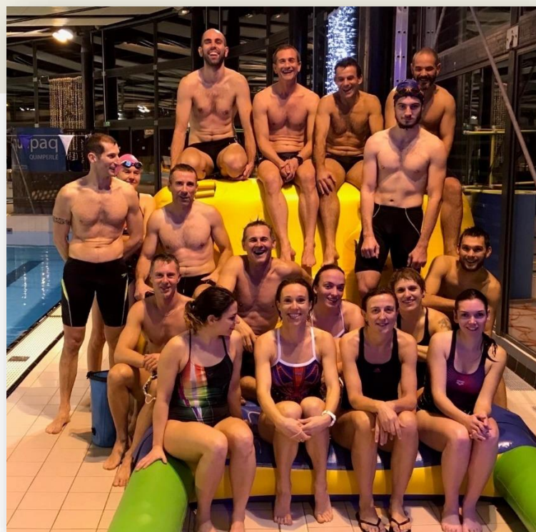
Le groupe à la piscine après les brimades des coaches!