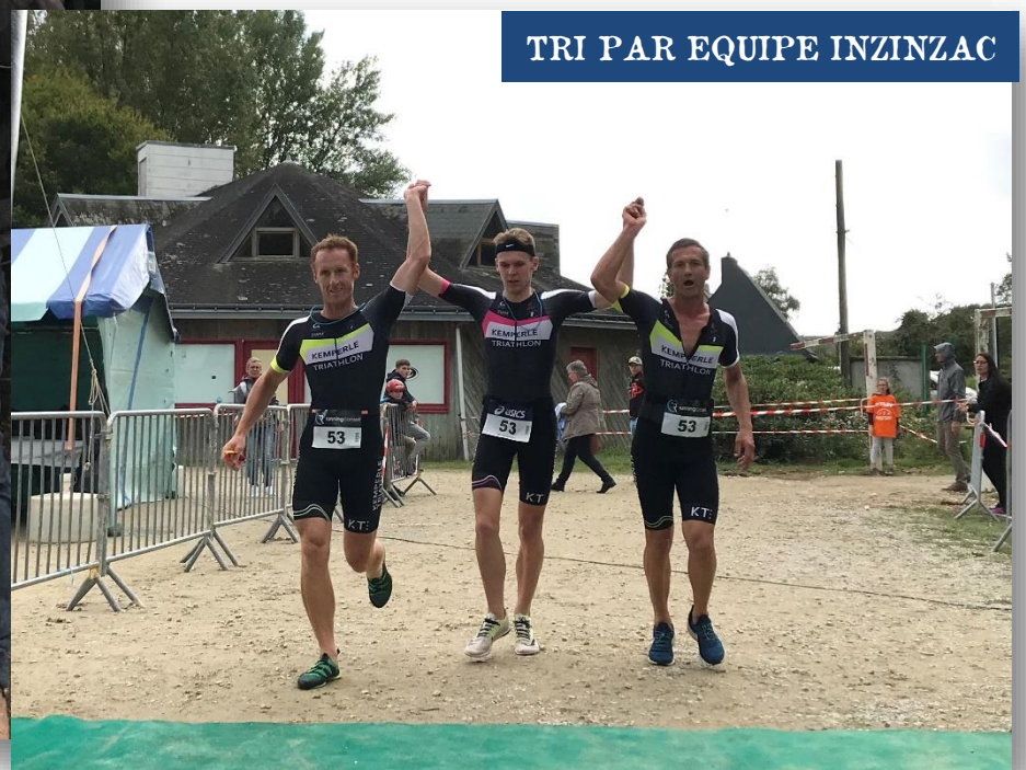
TRI PAR EQUIPE INZINZAC