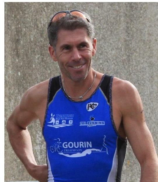
XLF à La Roche Bernard 2018

https://xlfoaching.wixsite.com/xlf-coaching