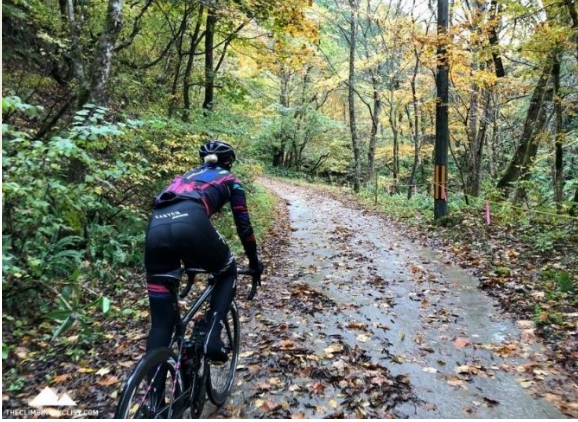
L'automne à vélo