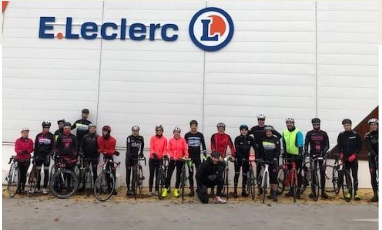
Les 20 KT de la sortie dominicale devant l'enseigne de notre principal partenaire au tri du Pouldu.