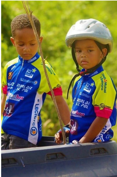
L'école de VTT de Téranga, futurs athlètes aux JO ?