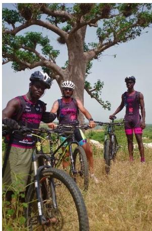
Les guides de Téranga bike, aux fières couleurs du KT !