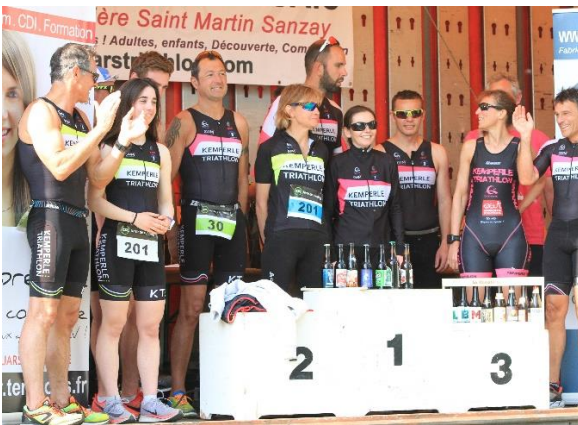
Les KT à Thouars en 2019, les filles 3 èmes par équipe.