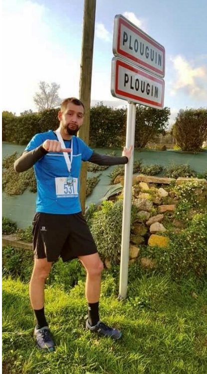
Pierre à.....devinez où!