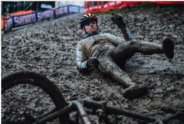
COMME UN LUNDI (à Quéven!)