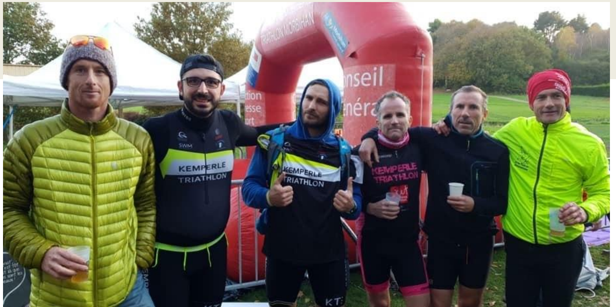
Run & bike de Quéven, championnat de Bretagne